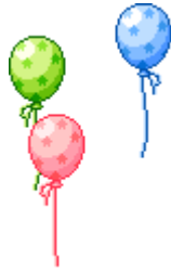
تابستانه ی ۱